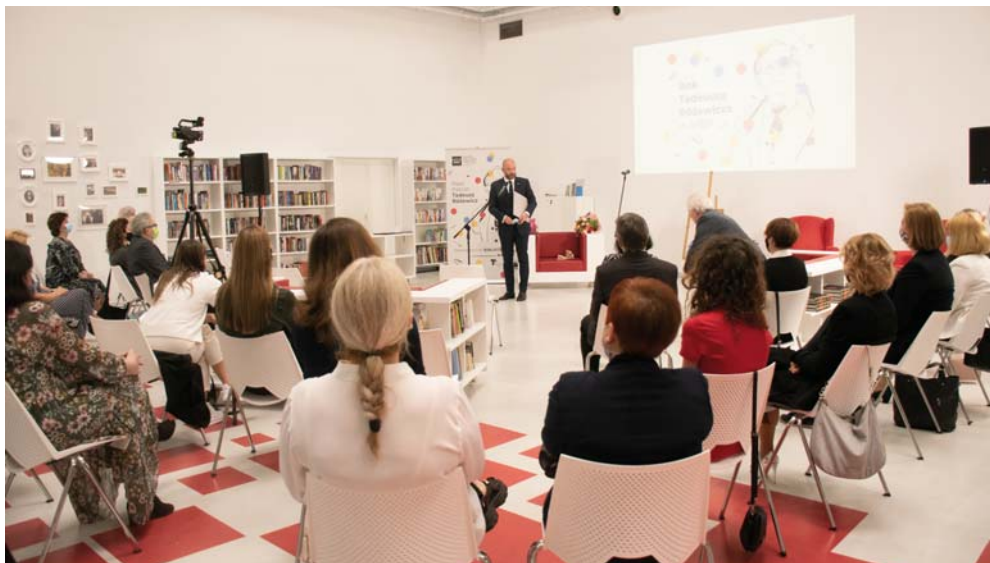
Przemawia prezydent Wrocławia Jacek Sutryk