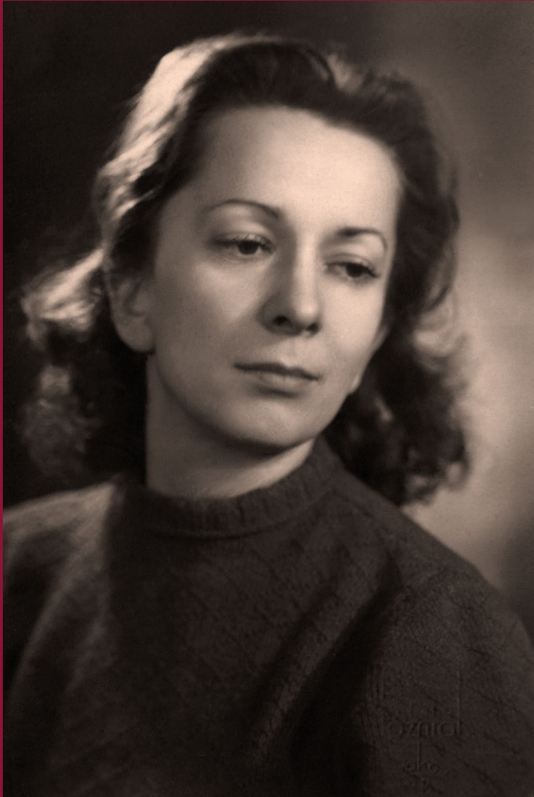
Wisława Szymborska w latach 50. XX wieku