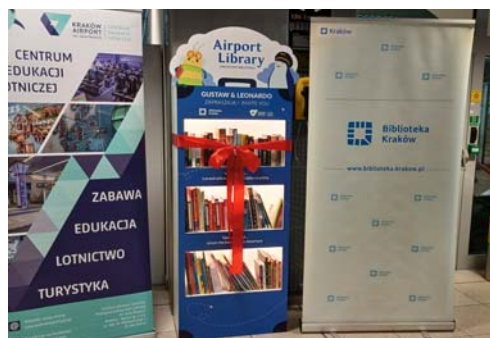
Hala odlotów Międzynarodowego Portu Lotniczego im. Jana Pawła II Kraków-Balice

i Dziedzictwa Narodowego w ramach programu Narodowego Centrum Kultury: Kultura – Interwencje. Edycja 2022. Celem przedsięwzięcia była integracja społeczności Krakowa i migrantów zza wschodniej granicy, a także pomoc osobom, które przyjechały z Ukrainy, by odnaleźć w mieście nie tylko bezpieczną przystań, ale i atrakcyjną ofertę kulturalną. W ramach projektu zorganizowano: cykl warsztatów z elementami biblioterapii, cykl warsztatów teatralnych, podczas których powstał dwujęzyczny spektakl, zajęcia artystyczne tworzenia ilustracji do teatru kamishibai połączone z rodzinnym konkursem plastycznym, spacer