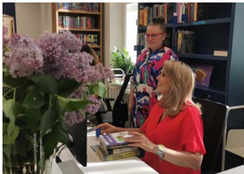
Akcja Znani za ladą, w której wzięła udział Ewa Wachowicz, Biblioteka Główna, ul. Powroźnicza 2