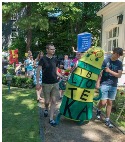
Wielka Parada Moli i Motyli Książkowych na czele z maskotką Biblioteki Kraków – molem Gustawem

8–15 MAJA Biblioteka Kraków włączyła się w organizację XIX Ogólnopolskiego Tygodnia Bibliotek przygotowanego pod hasłem „Biblioteka – świat w jednym miejscu”. Wszystkich miłośników książek zaproszono do odwiedzenia