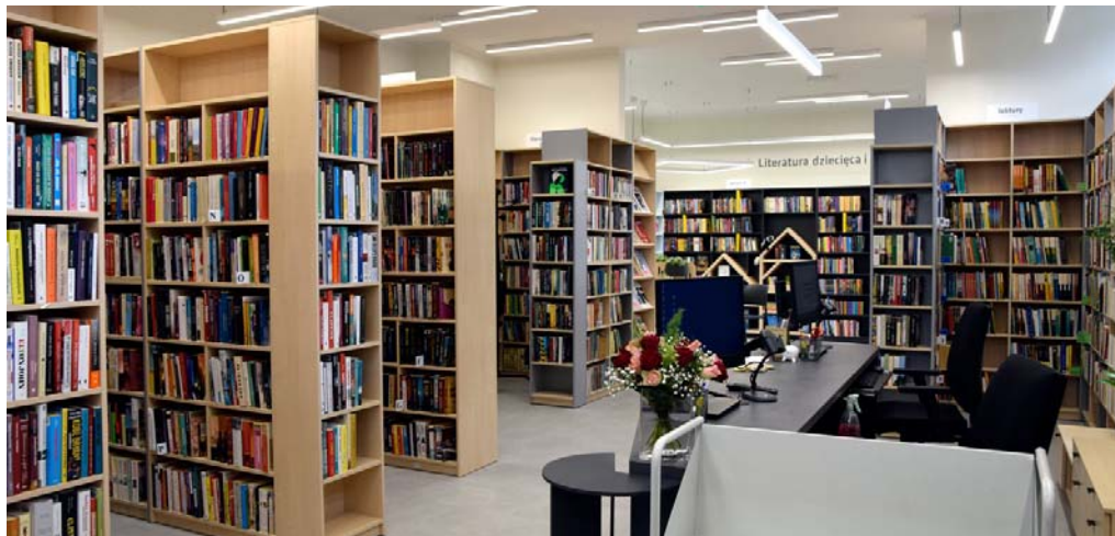
Filia nr 24, ul. Na Błonie 13d, po remoncie

8 LUTEGO podpisano Umowę o współpracy na lata 2022–2024 pomiędzy Biblioteką Kraków oraz Biblioteką Miejską w Zagrzebiu.