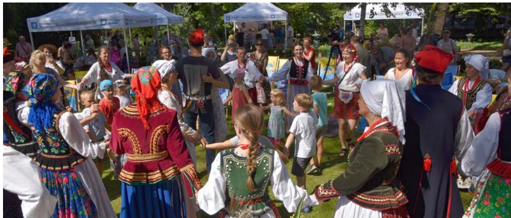
Etnopiknik zorganizowany w ogrodzie Biblioteki Głównej, ul. Powroźnicza 2