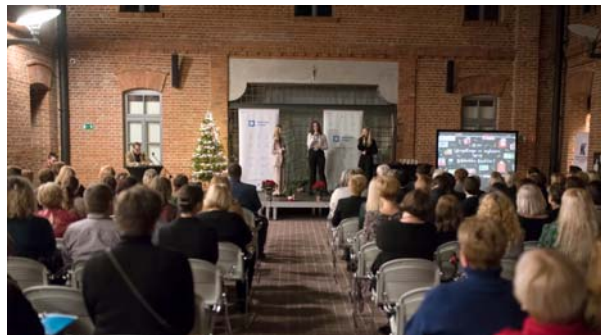
Świąteczne spotkanie w Muzeum AK, ul. Wita Stwosza 12

16–19 GRUDNIA dyrektor Biblioteki Kraków wraz z przedstawicielami Urzędu Miasta Krakowa udała się do Orleanu. W trakcie wizyty