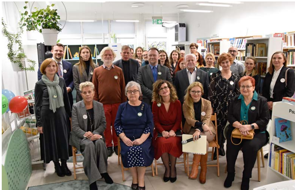
Sympatycy i przyjaciele Filii nr 8, ul. J. Brodowicza 1, świętującej 50-lecie działalności

18 LISTOPADA odbył się jubileusz 50 lat istnienia Filii nr 8 przy ul. Brodowicza 1. Były wspomnienia, kwiaty, tort oraz mnóstwo znakomitych gości.