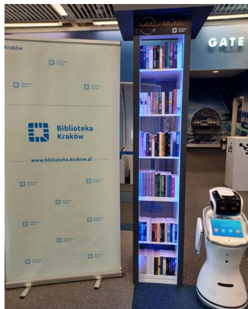
Uruchomienie w Centrum Edukacji Lotniczej Kraków Airport regału z książkami, fot. z archiwum BK

14 CZERWCA Biblioteka Kraków we współpracy z Centrum Edukacji Lotniczej Kraków Airport otworzyła „Odlotową Bibliotekę”, czyli podróżniczy regał bookcrossingowy dostępny w Centrum Edukacji Lotniczej.