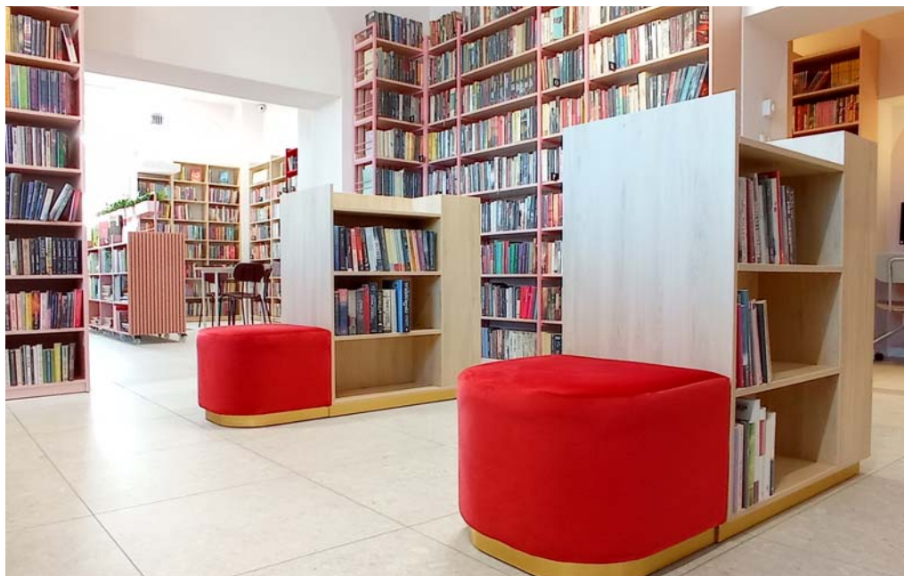
Filia nr 33, ul. Zakopiańska 103, po remoncie

4 MAJA ogłoszono kolejną edycję „Konkursu na najpiękniejszego mola i motyla książkowego”. Zadaniem konkursowym było wykonanie wielkoformatowej postaci mola lub motyla książkowego. Konkurs adresowany był do dzieci i młodzieży w wieku od 4 do 11 lat wraz z rodzinami, a także do grup dzieci w tym samym przedziale wiekowym z instytucji oświatowych i kulturalnych oraz organizacji pozarządowych z terenu województwa małopolskiego. Wyniki ogłoszono w czasie Wielkiej Parady Moli i Motyli Książkowych zorganizowanej 25 czerwca 2022 r. w ogrodzie przy Bibliotece Głównej.