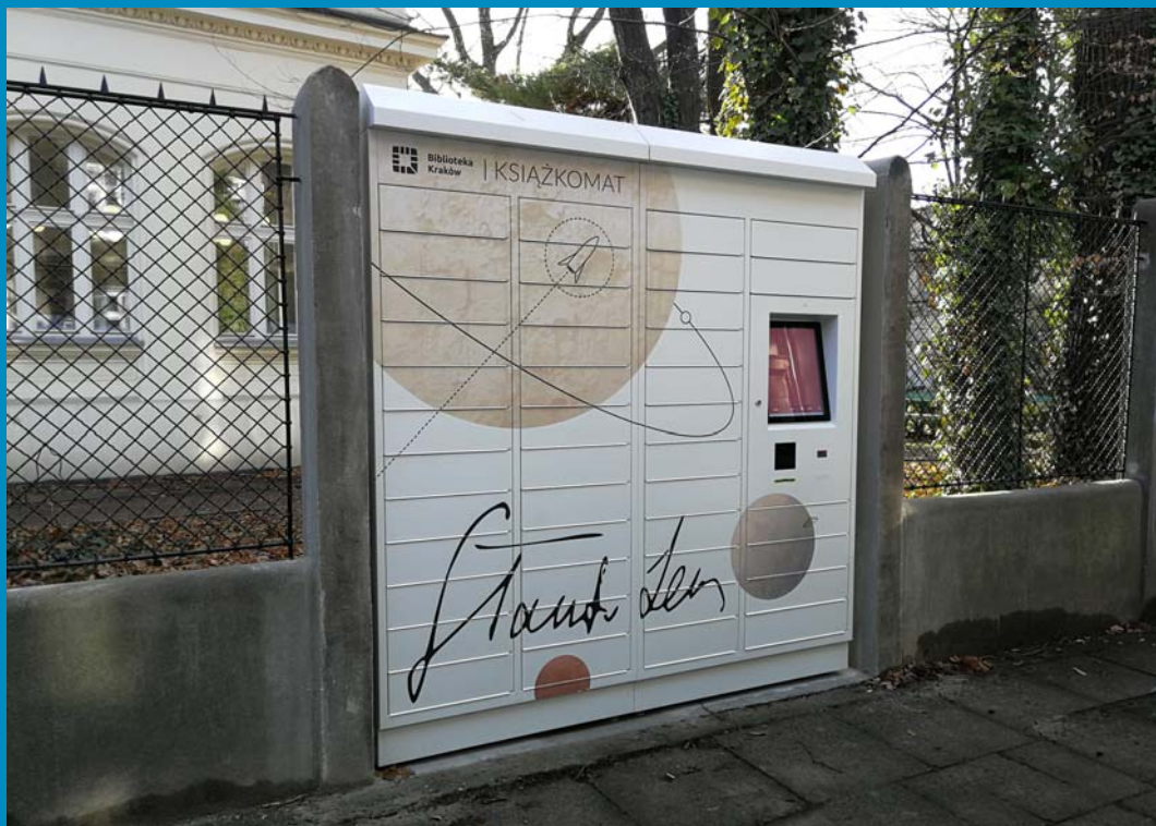
Książkomat przy Bibliotece Głównej, ul. Powroźnicza 2