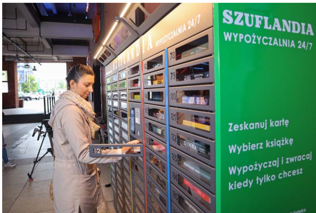
Szuflandia, Biblioteka Miejska w Łodzi, rynek Manufaktury

korzysta z tej formy i jakie książki najbardziej lubi. W tym roku rozpoczęliśmy w Szuflandii dystrybucję kodów dostępu do platformy Empik Go. Przyjęła się!